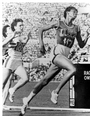
Wilma Rudolph